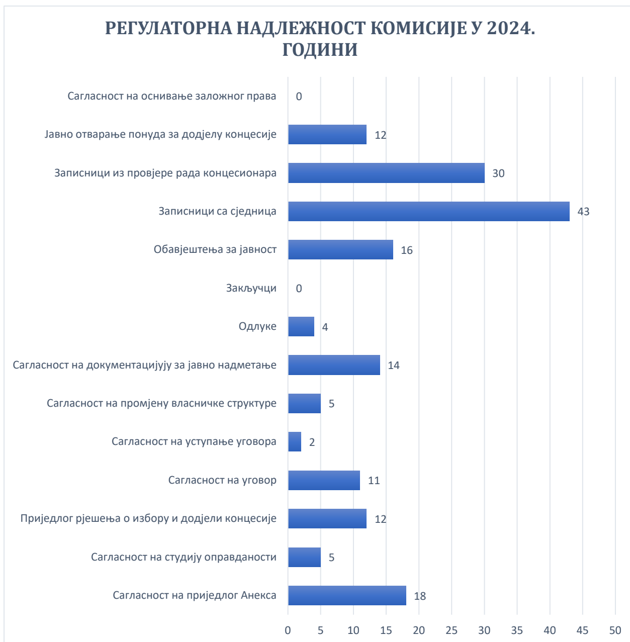
Слика 1 – Преглед аката из регулаторне надлежности Комисије за 2024. годину

До краја 2024. године, укупно је закључено 551 (пет стотина педесет један) 10 уговор о концесији. Од наведеног броја закључених уговора о концесији, Министарство енергетике и рударства закључило је 403 (четири стотине три) уговора, Министарство за просторно уређење, грађевинарство и екологију закључило је 1 (један) уговор о концесији, Министарство пољопривреде, шумарства и водопривреде закључило је 135 (стотину тридесет пет) уговора о концесији, Министарство саобраћаја и веза закључило је 4 (четири) уговора о концесији, Министарство трговине и туризма закључило је 6 (шест) уговора о концесији, Министарство