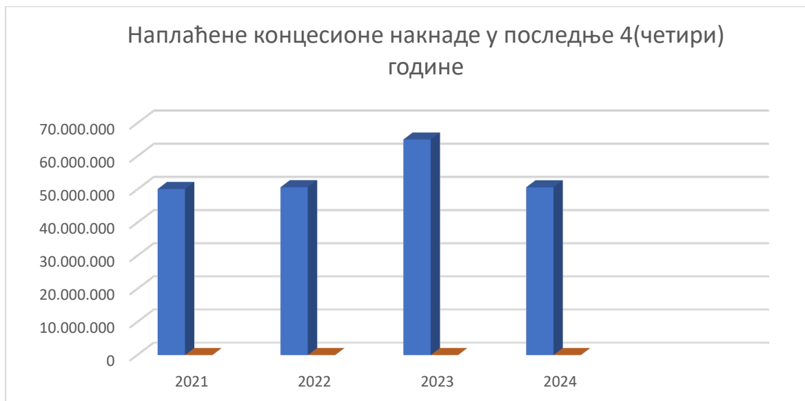
Слика 7 – Наплаћене концесионе накнаде у последње 4 (четири) године

Из напријед добијених података, видљиво је, да је на скоро свим врстама прихода забиљежено значајно смањење уплате по основу концесионе накнаде у буџет Републике за период 01.01.-31.12.2024. године.